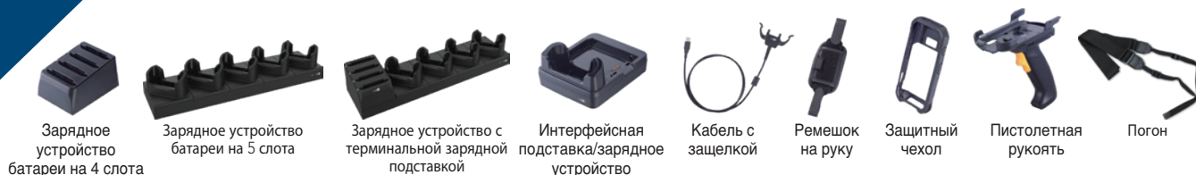
Зарядное устройство батарей на 4 слота