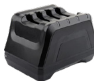
4-х зарядная станция для батарей