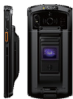
Фингерпринт - версия