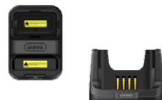
Подставка для подзарядки с одним разъёмом