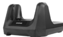
Зарядная станция (Cradle)